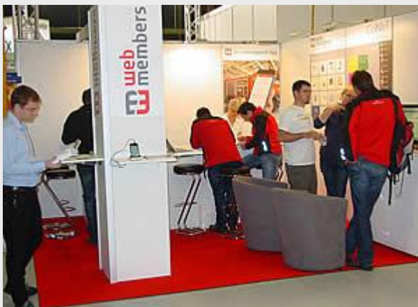
Intensive Gespräche an unserem Stand Demonstrationen von WebMembers 4.0